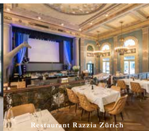
Restaurant Razzia Zürich