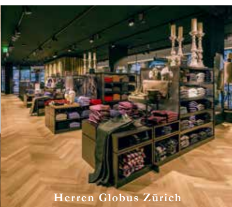
Herren Globus Zürich