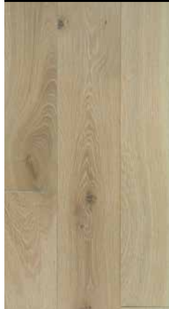
Pastis gealtert / sägeroh B: 110/130 mm, natur/rustikal