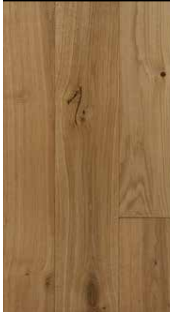
Cidre sägeroh B: 110/130 mm, natur/rustikal