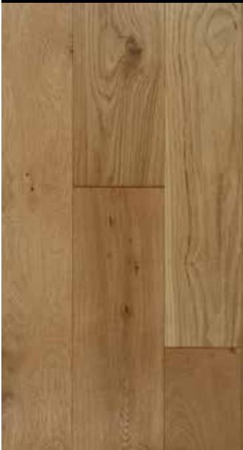
Cidre strukturgebürstet B: 110/130 mm, natur/rustikal