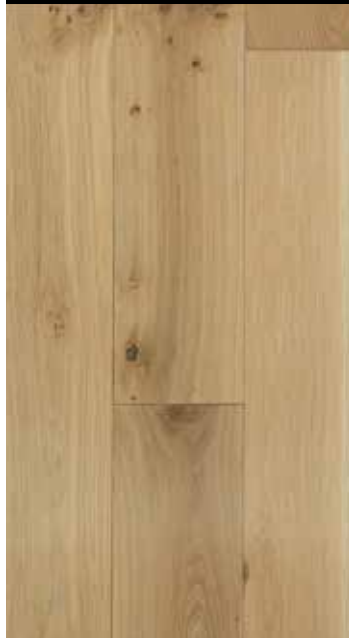
Pastis strukturgebürstet B: 110/130 mm, natur/rustikal