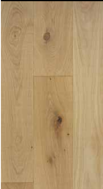
Crémant strukturgebürstet B: 110/130 mm, natur/rustikal