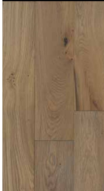
Mairesque strukturgebürstet B: 110/130 mm, natur/rustikal