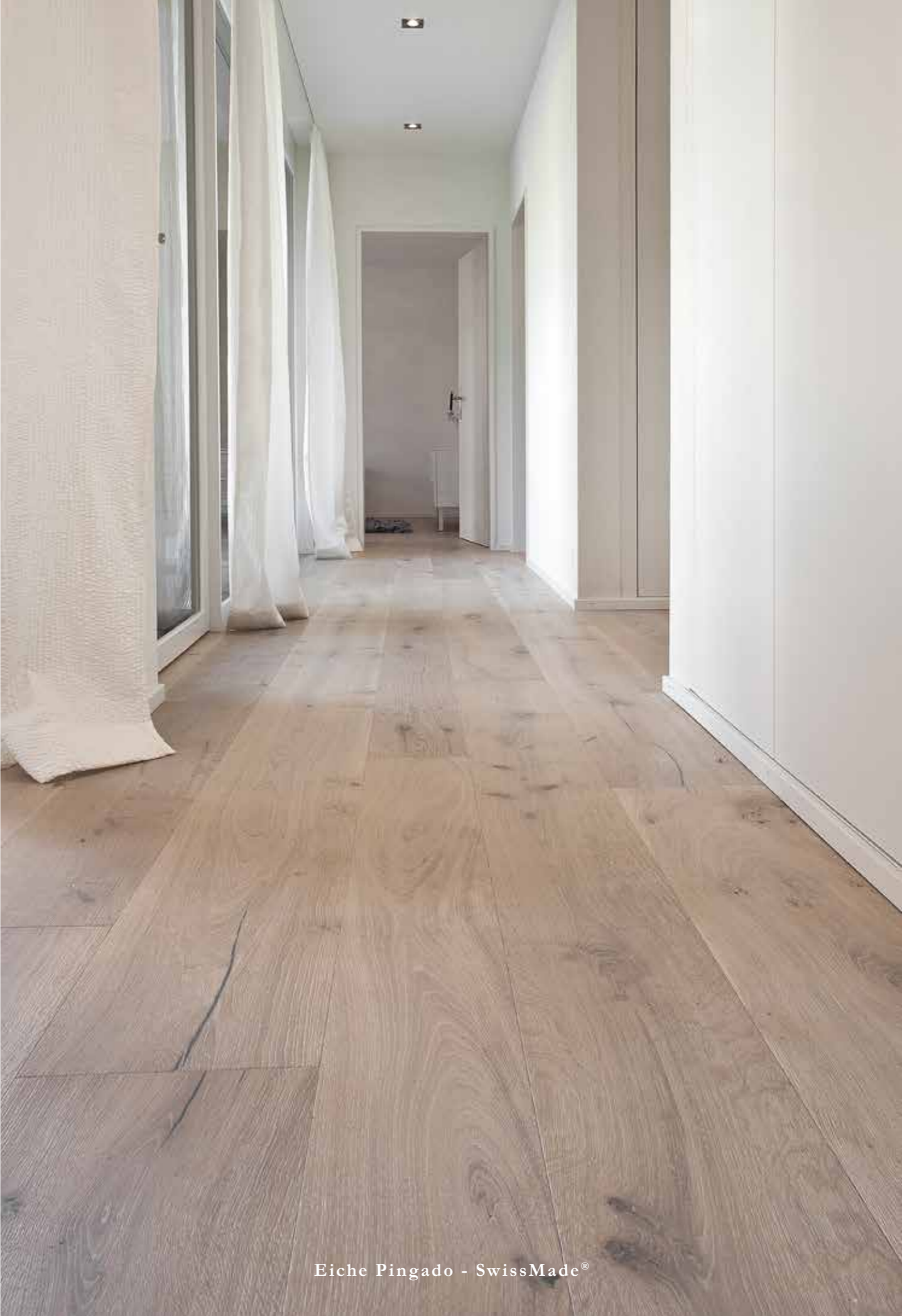
Eiche Pingado - SwissMade®