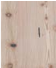
Lärche gebürstet, Basisseife