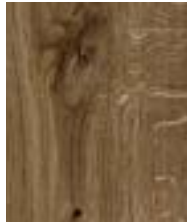
Eiche «Cabernet Dorsa»