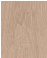
Eiche «Cabernet Blanc»